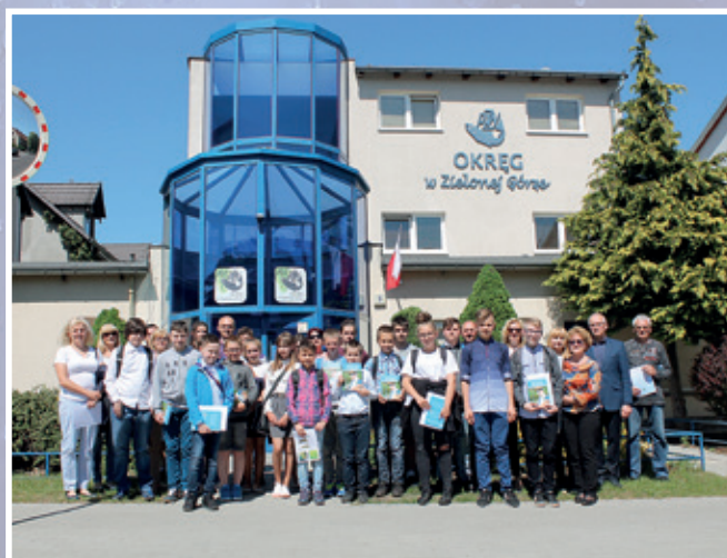
Finałiści konkursu wiedzy ekologicznej dla młodzieży 2018